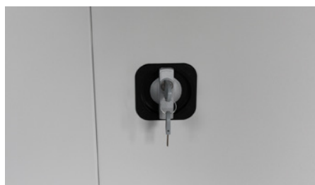
Serratura a maniglia